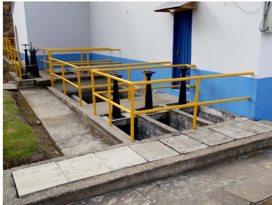
Planta de Tratamiento de Agua de Marulanda

La Empresa de Obras Sanitarias de Caldas “EMPOCALDAS S.A E.S.P” es una Sociedad Anónima Comercial de Nacionalidad Colombiana, del orden Departamental, clasificada como empresa de servicios públicos, con autonomía administrativa, patrimonial y presupuestal, que se rige por lo dispuesto en la Ley 142 de 1994 y la Ley 689 de 2001.